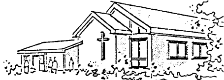
Gemeindehaus an der Lichtenbergstraße in Pivitsheide V.H.

Ev.-ref. Kirchengemeinde Pivitsheide, Gemeindebüro Albert-Schweitzer-Str. 78, 32758 Detmold - Pivitsheide